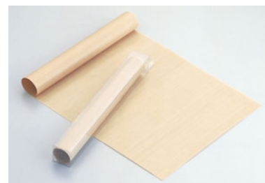
14-16 END ニューベーキングシート 1枚入(クリアケース入)

入数 フランスサイズ 585×385 686000010 5 別寸 525×380 686000020 5 6取 495×350 686000030 5 8取 385×300 686000040 5 ロール巻 1,000×10m (1枚) 517000050 材質 グラス繊維にフッ素樹脂加工 80ミクロン