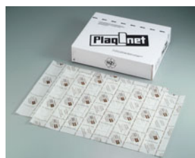
14-10 プラノパック ベーキングペーパー (500枚入)

499001760 ※ロールペーパーでの使用時には別売のノコ刃をセットして下さい。 ※ベーキングペーパーは別売です。