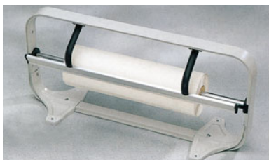
14-07 サーマー ベーキングロールペーパー

幅 長さ (mm) (m) 40cm 403×3 046007400 材質 グラスファイバーにシリコンラバー 耐熱温度 -40℃～260℃