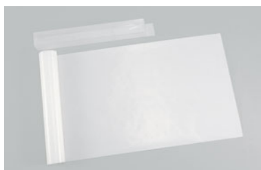
14-05 END ベーキングシート1枚入 (クリアケース入)

外寸 (mm) 入数 フランスサイズ 585×385 199000010 5 6取 495×350 199000020 5 材質 グラス繊維にフッ素樹脂加工 120ミクロン