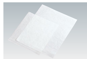
14-11 シリコンペーパー (1,000枚入)

外寸 (mm) 595×396 493002230 材質 両面シリコン加工耐油紙