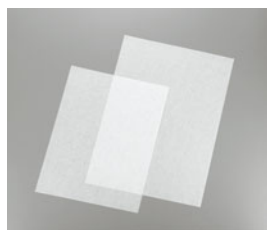
14-12 両面シリコンペーパー (500枚入)

500×350 526001030 600×400 526001040 耐熱温度 250℃ ※水蒸気を適度に通し、油分や水は通しません。