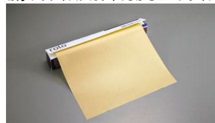
14-06 ロール式ベーキングマット

幅 長さ (mm) (m) 40cm 403×3 046007400 材質 グラスファイバーにシリコンラバー 耐熱温度 -40℃～260℃