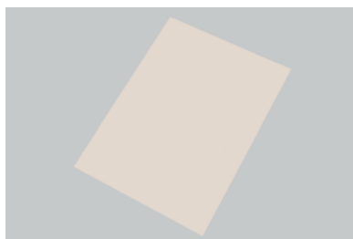
14-15 END ニューベーキングシート (10枚入)

外寸 (mm) フレンチサイズ 585×385 493001620 6取用 490×340 493001630 家庭用 290×210 493001640 材質 グラスファイバー&シリコン ※生地中の空気や余分な油が抜けるので、さっくりと焼き上げることが可能です。