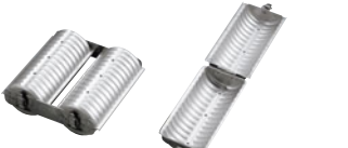
68-19 END アルスター バウンドトヨ型 スペシャル

内寸 (mm) 高さ (mm) 底寸 (mm) 入数 大 136×69×48 118×51 793000010 36 中 100×56×35 90×47 793000020 36 小 74×46×32 63×34 793000030 72