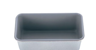
68-14 END アルフツプレス バウンドF2073

内寸 (mm) 高さ (mm) 底寸 (mm) 入数 128×66×40 118×56 790001540 材質 硬質アルミにフッ素樹脂加工