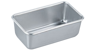
68-16 END 硬質アルミプレス バウンドSN2072

内寸 (mm) 高さ (mm) 底寸 (mm) 入数 No.2342 大 99×55×33 90×45 063009680 No.2343 小 73×46×28 68×38 063009690 材質 プリキ