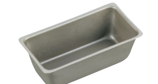
68-12 ベイクウェア ミニバウンドケーキ型

内寸 (mm) 高さ (mm) 底寸 (mm) 入数 PP-608 L 213×113×59 185×85 764001130 PP-609 M 199×98×53 175×75 764001140 材質 スチールにフッ素樹脂加工