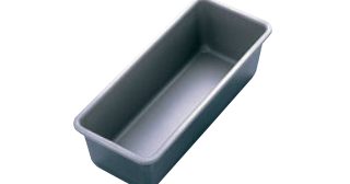
68-10 ブラックフィギュア バウンドケーキ細型

内寸 (mm) 高さ (mm) 底寸 (mm) 入数 大 210×110×60 195×95 045003850 5 中 200×95×52 175×75 045003860 5 小 170×82×50 150×60 045003840 5 材質 スチールにフッ素樹脂加工