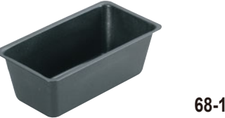
68-18 シリコン加工 ローパン

内寸 (mm) 高さ (mm) 底寸 (mm) 入数 100×55×35 91×47 790000400