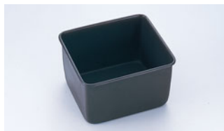
68-06 WJ テフロン バウンド型 ミニ

内寸 (mm) 高さ (mm) 底寸 (mm) 入数 155×75 65 145×70 500000410