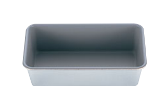
68-13 END アルフツプレス バウンドF2072

内寸 (mm) 高さ (mm) 底寸 (mm) 入数 135×68×45 125×55 669000480 10 材質 スチールにフッ素樹脂加工