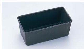
68-05 WJ テフロン バウンド型 S

内寸 (mm) 高さ (mm) 底寸 (mm) 入数 250×70 65 240×65 500000400