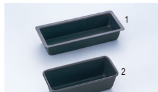
68-07 WJ テフロンバウンドモールド

内寸 (mm) 高さ (mm) 底寸 (mm) 入数 120×105 80 115×100 500000420