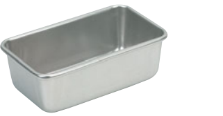
68-17 END 硬質アルミプレス バウンドSN2073

内寸 (mm) 高さ (mm) 底寸 (mm) 入数 128×66×40 118×56 790000390