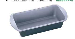
68-11 ニューパーティシール SVバウンドケーキ型

内寸 (mm) 高さ (mm) 底寸 (mm) 入数 大 240×78×60 230×70 045003820 5 中 205×78×60 200×70 045003830 5 小 167×78×60 160×70 045003810 5 材質 スチールにフッ素樹脂加工