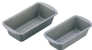
68-08 ベイクウェア ラウンド型

内寸 (mm) 高さ (mm) 底寸 (mm) 入数 165×60×35 160×53 500000430 1 130×55×45 120×45 500000440 2