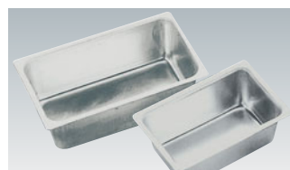
68-15 TP総絞りミニバウンド型

内寸 (mm) 高さ (mm) 底寸 (mm) 入数 100×55×35 91×47 790001550 材質 硬質アルミにフッ素樹脂加工