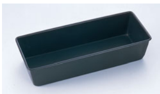
68-02 WJ テフロン ニューバウンドケーキ型

内寸 (mm) 高さ (mm) 底寸 (mm) 入数 250×95 85 240×85 500000360