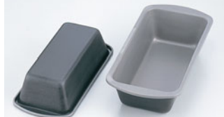
68-09 ブラックフィギュア バウンドケーキ深型

内寸 (mm) 高さ (mm) 底寸 (mm) 入数 L 212×112×61 190×90 669000170 10 M 200×98×55 174×74 669000180 10 S 174×84×50 148×60 669000190 10 材質 スチールにフッ素樹脂加工