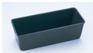
68-01 WJ テフロン マーブルケーキ型

内寸 (mm) 高さ (mm) 底寸 (mm) 入数 250×95 85 240×85 500000360