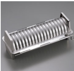
69-09 アルスター 合せトヨ型スリム

内寸 (mm) 高さ (mm) 大 250×108×95 063008770 小 200×108×95 063008780 材質 アルミメッキ鋼板に内面フッ素樹脂加工