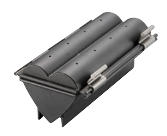
69-14 テフロン加工 ハートローパン SN2307