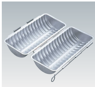
69-07 アルスター合せトヨ型

外寸 (mm) 高さ (mm) 内寸 (mm) 高さ (mm) 容量 (個) 245×105×75 225×65×60 700 999002780