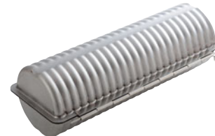
69-15 アルスター 合せトヨ型ジャンボ

外寸 (mm) 高さ (mm) 内寸 (mm) 高さ (mm) 容量 (個) 357×145×116 337×110×114 3,300 999002770