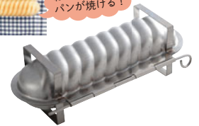
69-16 アルスター 合せトヨ型ねじねじ型

外寸 (mm) 高さ (mm) 内寸 (mm) 高さ (mm) 容量 (個) 245×105×75 225×65×60 700 999002780