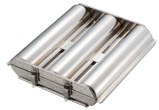
69-03 トリプルトースト 341712

外寸 (mm) 高さ (mm) 単品内寸 (mm) 重量 (kg) 400×315×105 φ105×275 約4.1 877000190