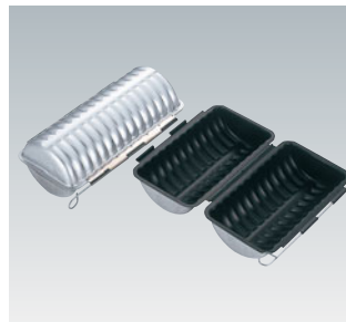
69-08 プロアスター合せトヨ型

内寸 (mm) 高さ (mm) 大 250×108×95 063008750 小 200×108×95 063008760 材質 アルミメッキ鋼板