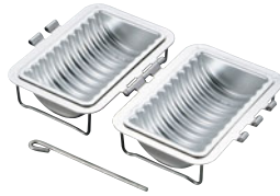
69-06 アルミ ミニ合せトヨ型

内寸 (mm) 341705 φ70×240 412014150 341706 φ70×300 412018530 341707 φ70×360 412018540 材質 鉄にスズメッキ