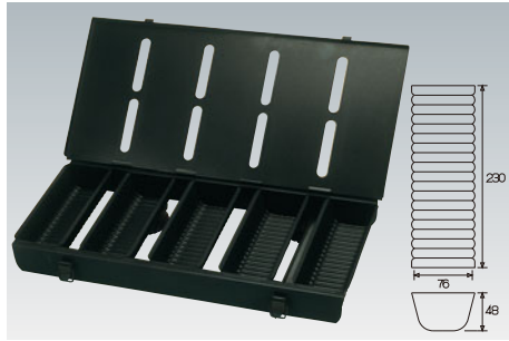
69-01 END フッソ加工 レーリュッケン5連結 SN9111