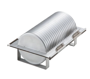
69-13 テフロン加工 ウェーブローパン SN2305