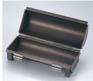
69-12 テフロン加工 ラウンドパンケース SN2304

内寸 (mm) 高さ (mm) 280×100×100 500000570 材質 スチールに内外テフロン加工