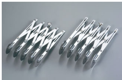
229-01 END 五連カッター