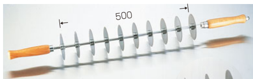
229-09 END ステンレス ロールカッター (10枚刃)