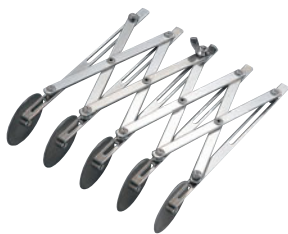
229-02 WT 伸縮パイカッター