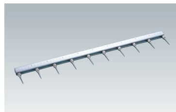
229-15 WJ フリーメジャースケール10マーク