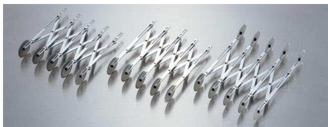
229-04 サーモ フラット5連カッター 68805

※ロール刃の回転がとてスムーズで使いやすくなり、刃間の調節もスムーズで誤差も少なくなりました。