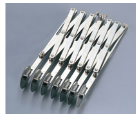
229-12 END 伸縮パイカッター7連 82333