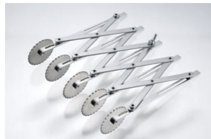
229-03 WT 伸縮パイカッター ギザ