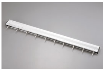
229-13 END スライドスケール (10マーク)