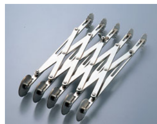
229-08 END パイカッター5連ダブル 82332(フラット/ギザ)