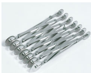
229-07 END パイカッター7連ダブル 82334(フラット/ギザ)