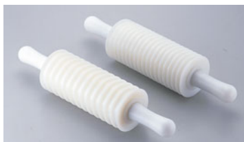
229-10 サーモ カuttingローラー