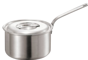
404-05 ロイヤル シチューパン