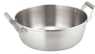
404-10 ロイヤル天ぷら鍋