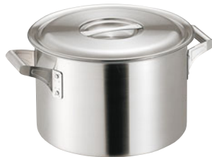
404-02 ロイヤル 半寸胴鍋