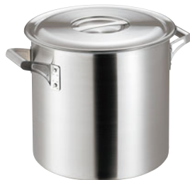
404-01 ロイヤル 寸胴鍋