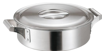
404-03 ロイヤル 外輪鍋