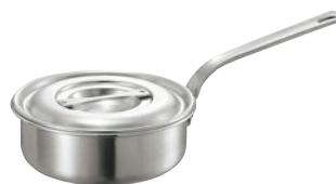
404-06 ロイヤル ソティパン