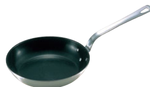
404-09 ロイヤルテフロンフライパン