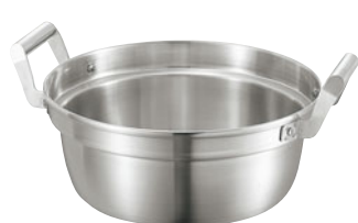
404-04 ロイヤル 和鍋