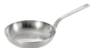
404-08 ロイヤルフライパン