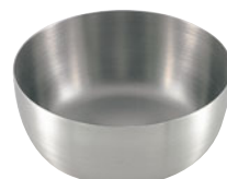
404-07 ロイヤルヤットコ鍋