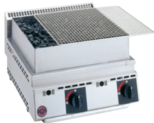
776-09 厨太くん炉ばた焼 YK-Z2