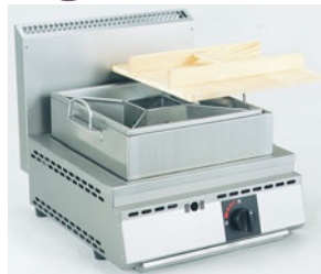
776-01 厨太くん 湯煎式おでん鍋 ON-Z1