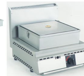
776-07 厨太くんスチーマー SS-Z1