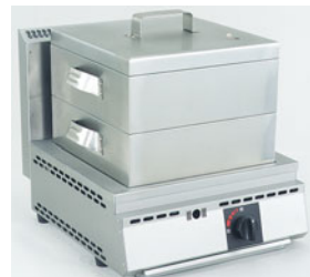
776-05 厨太くん角蒸し KS-Z1