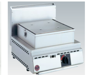
776-08 厨太くんスチーマー SW-Z1