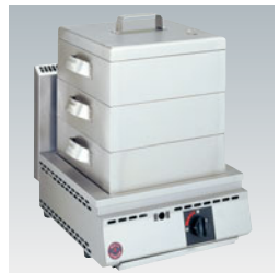
776-06 厨太くん角蒸し KW-Z1