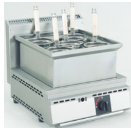
776-02 厨太くんうどん・そば UD-Z1