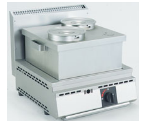
776-04 厨太くん ポットウォーマー UW-Z1