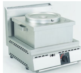
776-03 厨太くん ポットウォーマー US-Z1