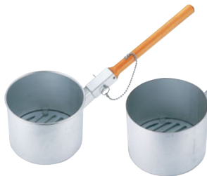
787-11 鑄物皿付ジャンボ火起し

外径 (mm) 高さ (mm) 重量 (kg) 入数 285 170 3.3 3 487000260 付属品: ステン火皿・クロームメッキ台