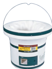
787-04 木炭コンロ (つる付)中型 C-8

外径 (mm) 高さ (mm) 重量 (kg) 入数 220 180 2.5 8 487000120 付属品: 土火皿(小)