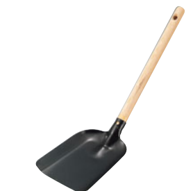
787-14 木柄 十能スコップ