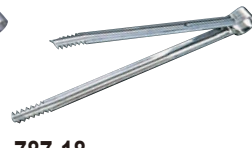
787-18 セフティー厚口炭バサミ

全長 (mm) 商品番号 8寸 240 068001760 尺0 300 068001770 尺2 365 068001780