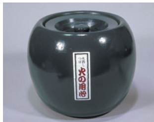
787-08 夏目火消しつぼ紺 (陶器製)

外径 (mm) 高さ (mm) 重量 (kg) 入数 285 245 5.2 2 487000140 付属品: 土火皿(大)