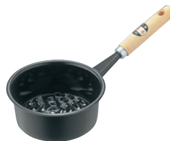
787-12 木柄ホーロー 火起し(イモノ底)

・使いきりタイプ ・子供の安全を考えた安心の2段階着火 ・色の指定はできません。