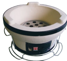
787-07 ジンギスこんろ B-18

外径 (mm) 高さ (mm) 重量 (kg) 入数 285 170 3.3 3 487000260 付属品: ステン火皿・クロームメッキ台