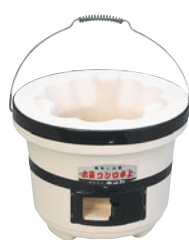
787-03 木炭コンロ卓上 (つる付)小型 C4-1

外径 (mm) 高さ (mm) 重量 (kg) 入数 220 180 2.5 8 487000120 付属品: 土火皿(小)