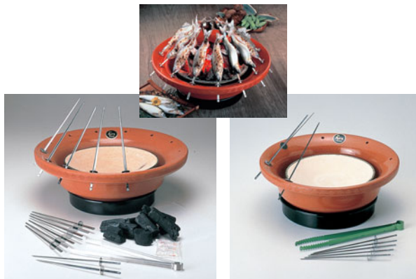
787-01 串焼ろばた 大 B-1

外径 (mm) 高さ (mm) 重量 (kg) 入数 420 145 10.0 8 487000100 付属品: 金串 14本、ステン火ばさみ 着火剤、炭1回分