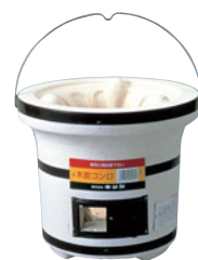
787-05 木炭コンロ (つる付)大型 C-9

外径 (mm) 高さ (mm) 重量 (kg) 入数 260 235 4.0 4 487000130 付属品: 土火皿(小)