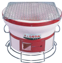
787-06 卓上しちりん C-6

外径 (mm) 高さ (mm) 重量 (kg) 入数 360 145 6.5 8 487000110 付属品: 金串 8本、火ばさみ