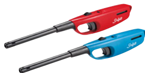
787-10 多目的ライター CR マイティマッチ

サイズ 外径 (mm) 高さ (mm) 重量 (kg) 商品番号 大々 φ235 190 928000010 大 φ225 185 928000020 中 φ205 165 928000030 材質 鉄鍍物