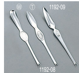
1192-08 18-0 エビカニフォーク

※従来品との比較でわかるこの違い! ※「カニは食べにくい。」の常識が 解消されました。