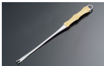
1192-10 18-8 夕華 カニフォーク