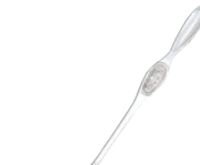
1192-15 18-10 カニ フォーク(ミニ)