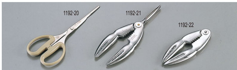
1192-20 シルキーカニ専用バサミ KUS-210