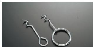
1192-17 サザエのつぼ焼取り (大小2本セット)

全長(mm) 110 ステン 072000050 ゴールド 072000080 シルバー 072000090