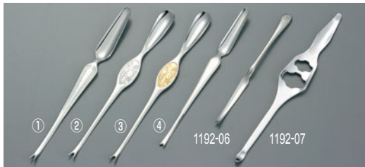
1192-05 18-8 カニフォーク