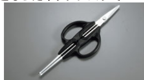
1192-19 カニフォークハサミ