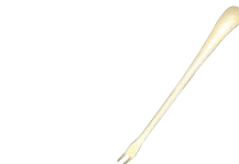
1192-13 ステンカニフォーク ゴールド

幅(mm) 全長(mm) 17×166 183000030 材質 18-8ステンレス