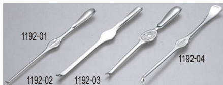
1192-01 18-8 カニフォーク