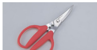
1192-18 カニチョコキカニバサミ

全長(mm) 大/65 小/55 404002530 材質 鉄(クロームメッキ)