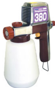
185-06 タフエアレス 380