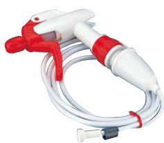
185-08 キャニオン フレキシブル付スプレー