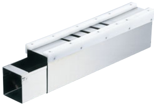
185-01 カンナ式チョコレート削り機