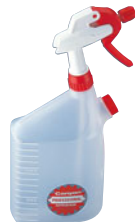
185-09 キャニオンプロスプレー C・T・S-4700

※18ℓ缶、バケツ、洗面器やその他 口径の広い容器等から直接に液 体を噴霧ができます。