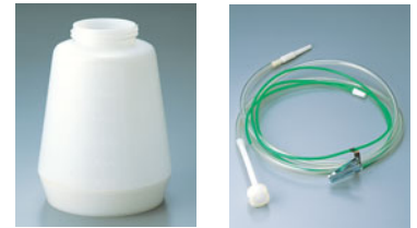
185-07 セイワ・パワースプレーオプション部品

コンテナ 1,200cc 530000060 ロング・セクションセット(2m) 530000070 ※コンテナを使用せず、チョコレート ウォーマーから直接スプレーしたい時に便 利です。