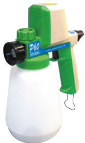
185-05 パワースプレー P-60

穴サイズ 9×3.5mm ・チョコレート、ジンジャー、ソフトチー ス、オニオン、ココナッツ等